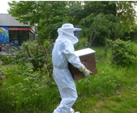
Angebote in der Mittagspause Schuljahr 2019/20 2. Halbjahr

In den Pausen am Vormittag sorgen ca. 15 fleißige Mütter ehrenamtlich für ein leckeres und günstiges Frühstückangebot.